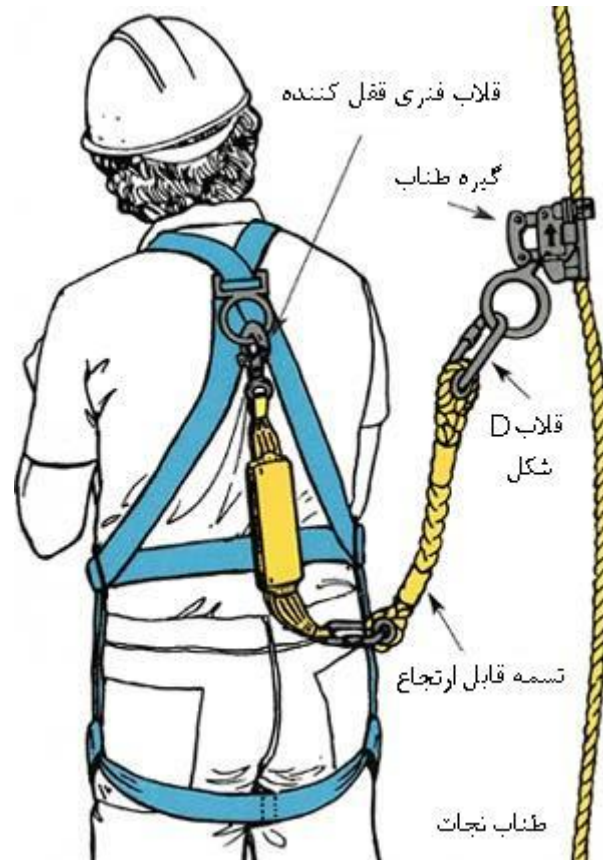
شکل 5. اجزای حمایل ایمنی

قلاب‌های ضامن‌دار است به نقاط ثابتی متصل می‌شوند. همچنین تسمه‌های قابل ارتجاع (Lanyard) جهت ایجاد خاصیت ارتجاعی و کاهش اثر شوک ناشی از سقوط به بدن و بعنوان رابط میان طناب نجات و حمایل یا کمربند ایمنی استفاده می‌شود. (شکل 5)