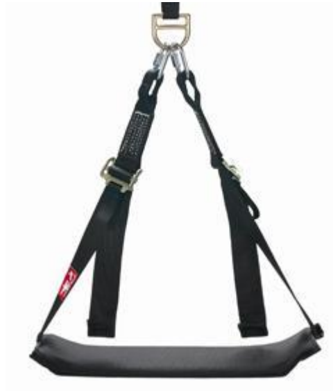
شکل 6. نشیمنگاه کار در ارتفاع