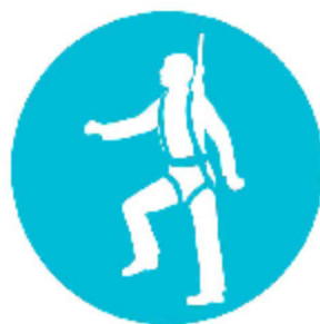
شکل . تابلو ایمنی : از کمربند ایمنی استفاده کنید