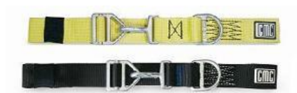
شکل 4 . کمربند ایمنی

سقوط در ارتفاع کم محسوب می‌شوند . (شکل 4)