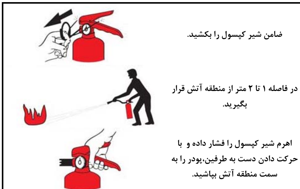
شکل ۱- برچسب اطلاعات مربوط به نحوه استفاده از کپسول آتش نشانی (بطور مثال)

در شکل ۱ نمونه ای از برچسب مربوط به اطلاعات نحوه استفاده از کپسول آتش نشانی آورده شده است.